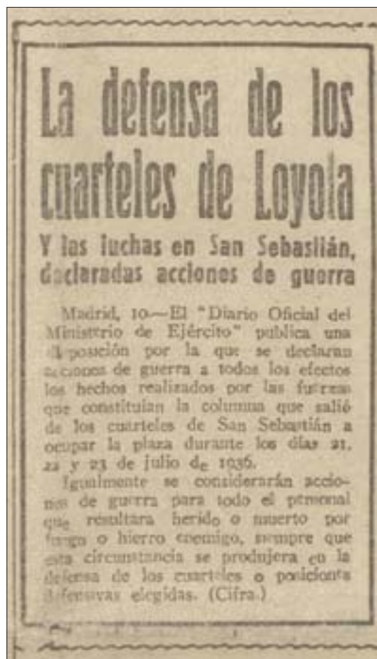
Recorte de prensa de 1943 con la declaración oficial de la batalla de San Sebastián y del asedio a los cuarteles de Loyola como acciones de guerra. Hoja Oficial del Lunes de la Provincia de Guipúzcoa.