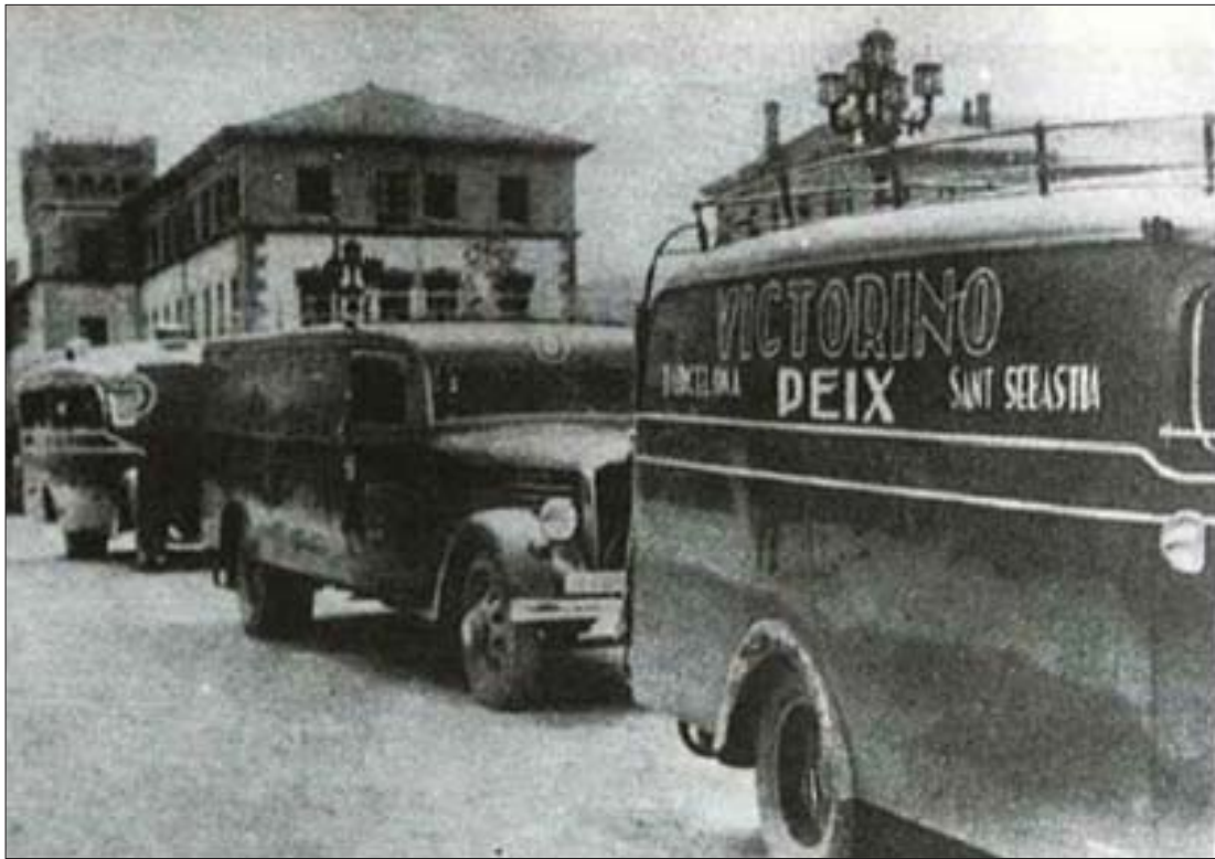
Vehículos para transportar al personal rendido en los cuarteles. ÉRI .