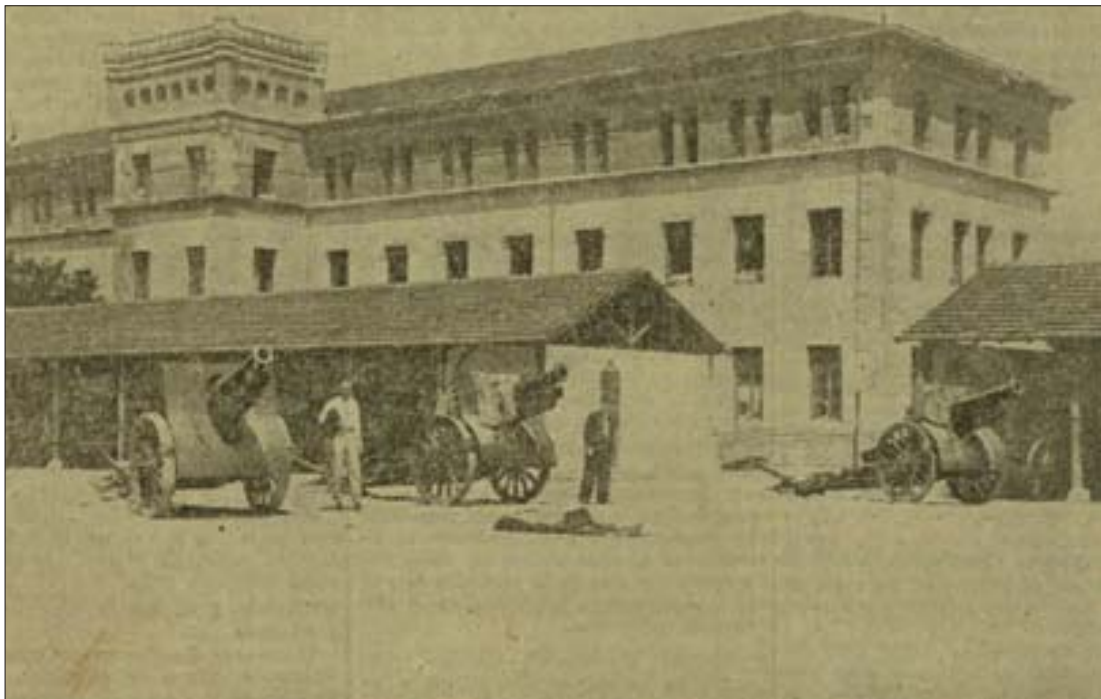
Batería de cañones, fotografiados tras el asedio. Euzkadi .