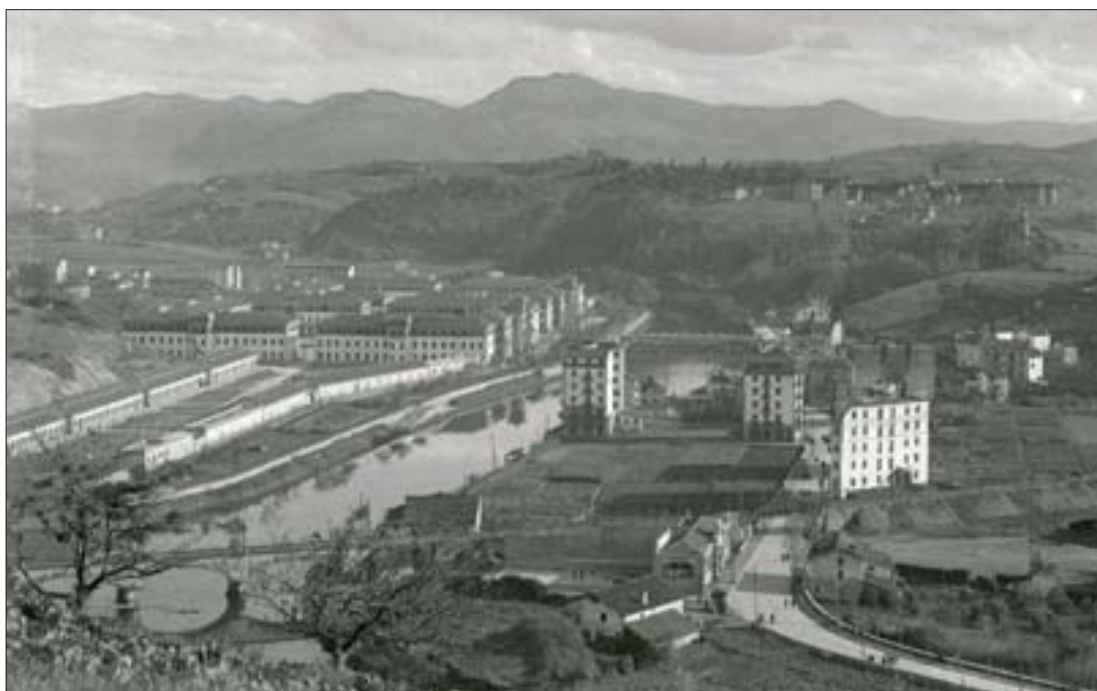
Perspectiva de los cuarteles de Loyola, entre 1928 y 1937.