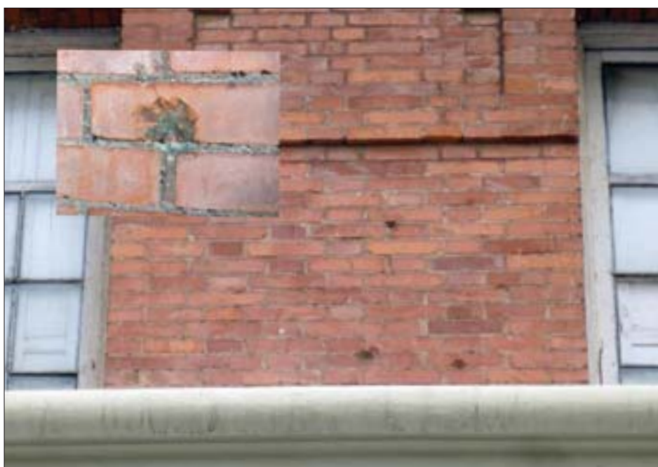
Impactos en las fachadas de los cuarteles de Loyola. Miguel A. Domínguez Rubio.