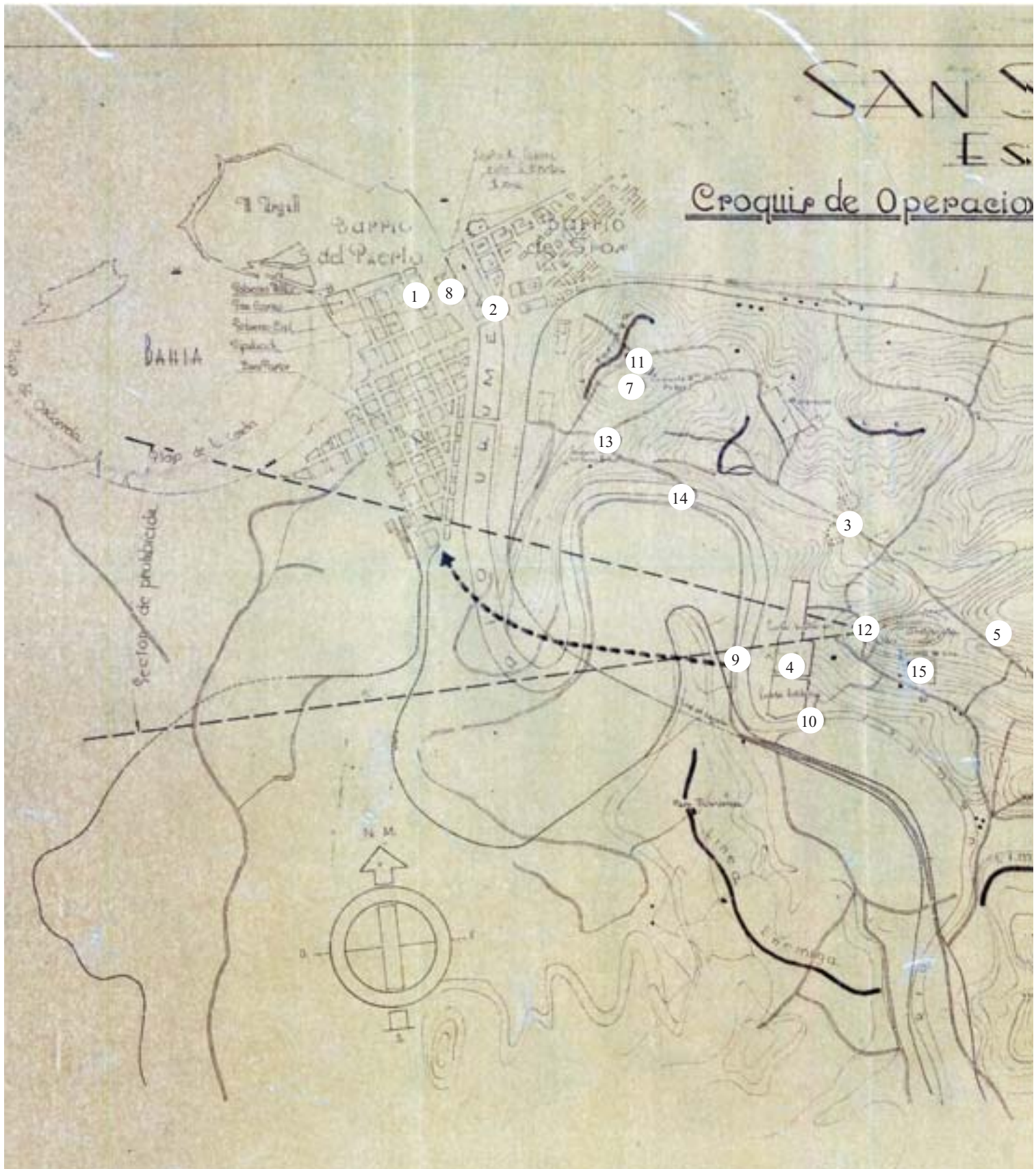
Plano de San Sebastián (escala 1:10.000), con croquis de las operaciones militares de julio de 1936, realizado