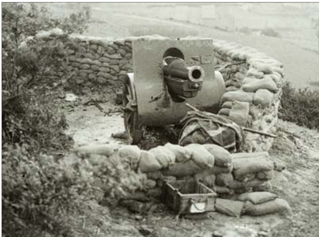
Cañón de 155 mm en la posición del monte Ametzagaña. Gordegia.

A partir de este momento difieren las versiones. Según el propio testimonio/juicio de Vallespín, éste lo expone a los mandos y propone una salida hacia Navarra logrando reunir a 21 oficiales y un sargento. Ante la evidencia de que está solo, en la madrugada del día 28, José Vallespín, en estos momentos ex-teniente coronel por su condición de sublevado, abandona los cuarteles de Loyola por la zona de Ametzagaña camino de Navarra.