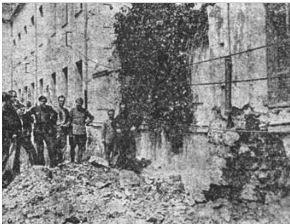
“Destrozos causados por las bombas que arrojó el trimotor sobre los cuarteles. La explosión hirió a seis soldados y acabó con la escasa moral de los facciosos”. Frente Popular .