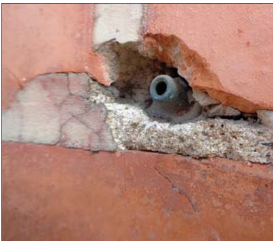
Impacto en la fachada de los cuarteles de Loyola con bala original 90 años después. Miguel A. Domínguez Rubio.