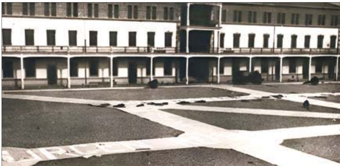
Mensaje escrito en uno de los patios de los Cuarteles.

Una fuerza y un armamento formidable sin duda, siempre que fuese explotado convenientemente por la Infantería en una guerra convencional. En esta ocasión, sin embargo, lo que se encontraron al otro lado de la trinchera eran combatientes fuertemente motivados, pero deficientemente armados y pésimamente organizados para una campaña militar. Un ambiente urbano, de guerrilla. Como ya se ha explicado, el número de combatientes y las capacidades de los medios de combate que se emplearon para materializarlas, en esta ocasión no fueron la clave de la victoria.