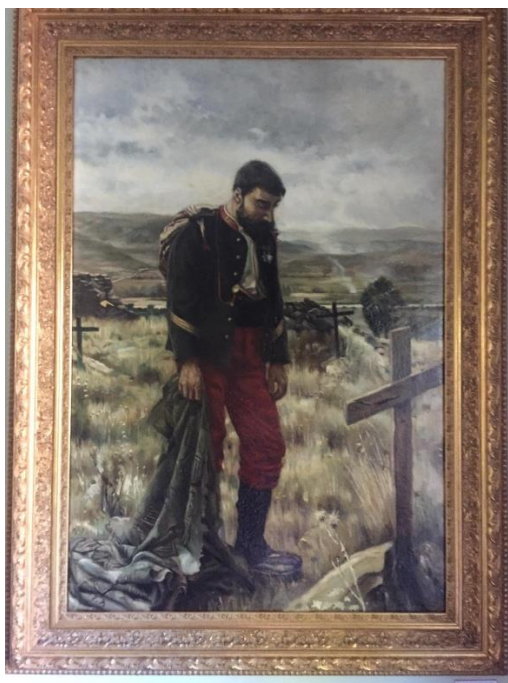
Cuadro expuesto en el Museo Carlista de El Escorial (Madrid)

Con el tiempo, y dedicado a otras tareas, husmeando por las hemerotecas, me di de bruces con la imagen de ese cuadro, con el mismo sargento, o al menos así lo creí en un primer momento, pero resultó luego que, escrutando la imagen con más detenimiento, llegué rápidamente a la conclusión de que el cuadro expuesto en el Museo Carlista era una réplica o reproducción (muy buena, por cierto) del que ahora tenía ante mí, un cuadro que supuse anterior. Es cierto que podía haber razonado a la inversa, toda vez que desconocía la fecha del primero de ellos, pero no me pareció razonable que se hiciera una copia grande de un cuadro chico.