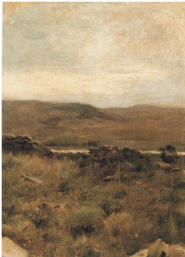
Paisatge amb runes (1892)