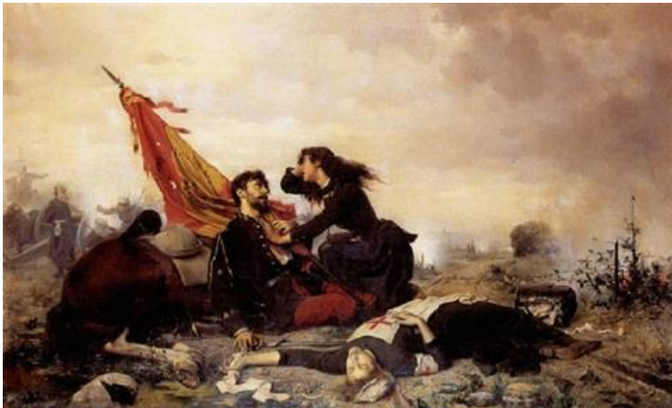
Patria, Fides, Amor (1884)