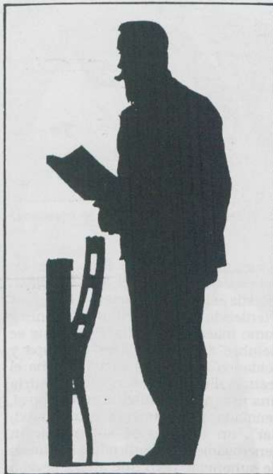
Para muchos jóvenes de los últimos cien años el maestro de escuela era un personaje solo conocido por referencias ajenas.

Napoleón. Lo cierto es que en 1822 aparecía publicado en la Gaceta un Real Decreto por el que se creaban en las capitales de distrito militar las "Escuelas de enseñanza mutua". En estos centros, los primeros reglamentados oficialmente para uso de la tropa se debía "enseñar a leer y a escribir por el método de Lancaster". Y aquí aparece ya la figura del sargento como maestro: "deberían asistir (a las clases) un oficial, un sargento, un cabo y dos soldados". Desde ese momento comienzan a funcionar, mejor o peor, unas escuelas a las que asisten regularmente los soldados analfabetos,