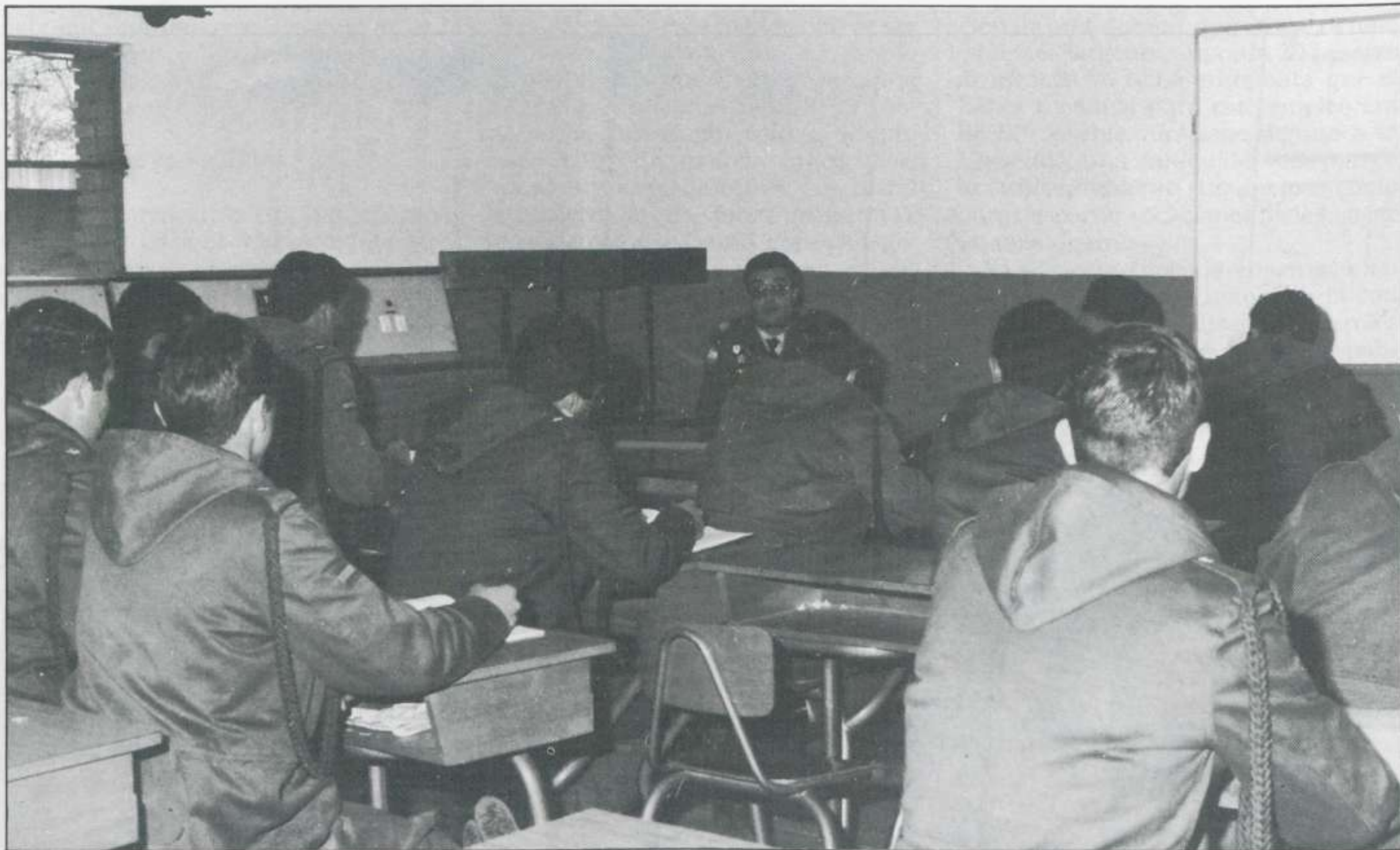
El Suboficial es hoy maestro de especialidades que van más allá del ámbito militar.

cios en la administración civil regresaron en pocos meses al ejército, entre ellos los que aún quedaban en calidad de monitores de gimnasia. Pero en las Normales de Magisterio continuaron estudiando los que lo estaban por la disposición de Primo de Rivera. Así, al producirse la reducción de efectivos, que por fortuna para estos alumnos comenzó en el verano, después de acabar el curso, varios, de todas las guarniciones, se acogieron al Decreto y causaron baja en la milicia para engrosar la lista de maestros civiles procedentes de sargento.