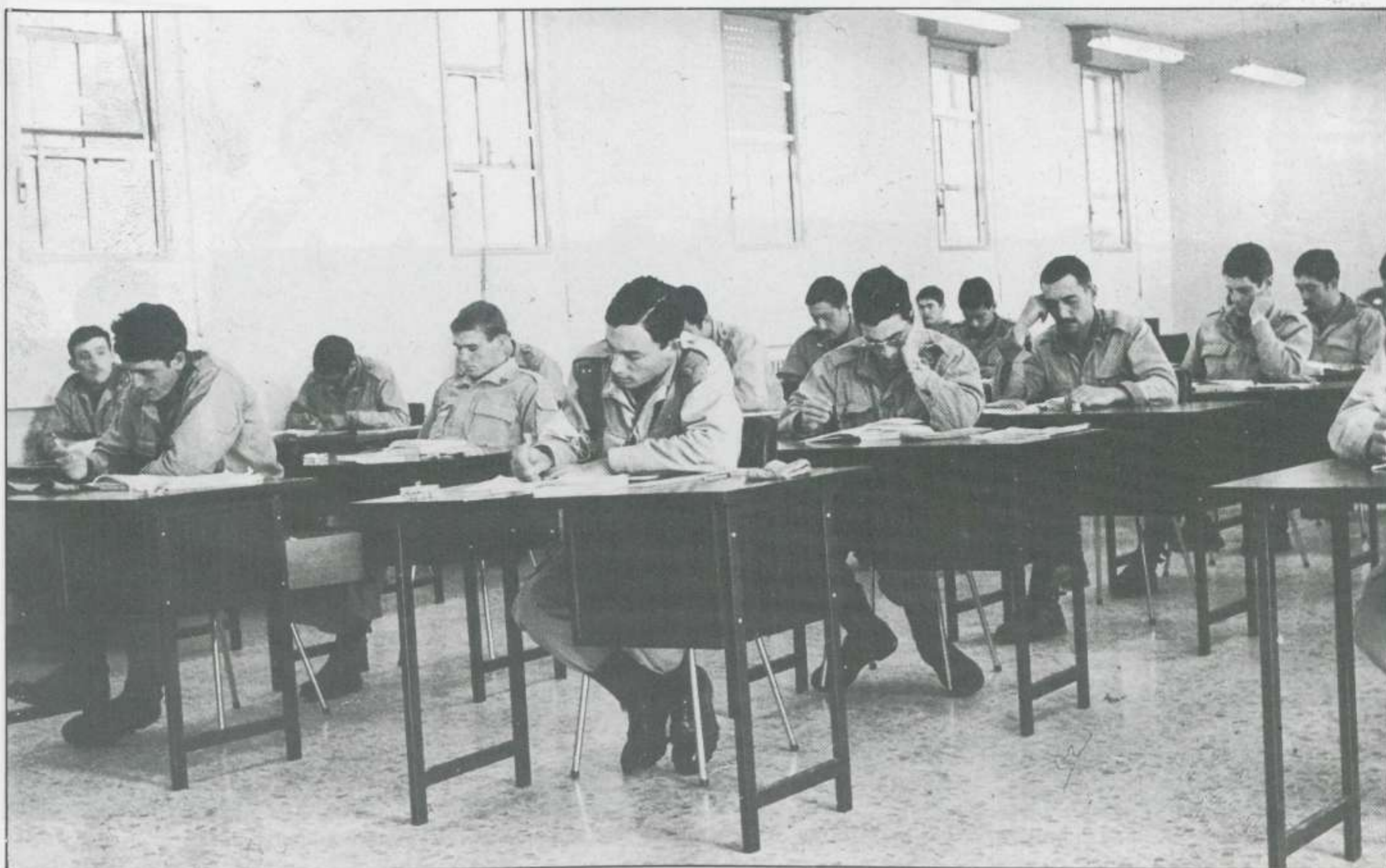
Una sólida cooperación interministerial garantiza actualmente el desarrollo de los programas de extensión cultural en las FAS.

estar titulados en la correspondiente escuela de Toledo, pasaban a la órdenes del delegado gubernativo, quien los enviaba a los distintos grupos escolares de su demarcación para impartir las clases a los niños.