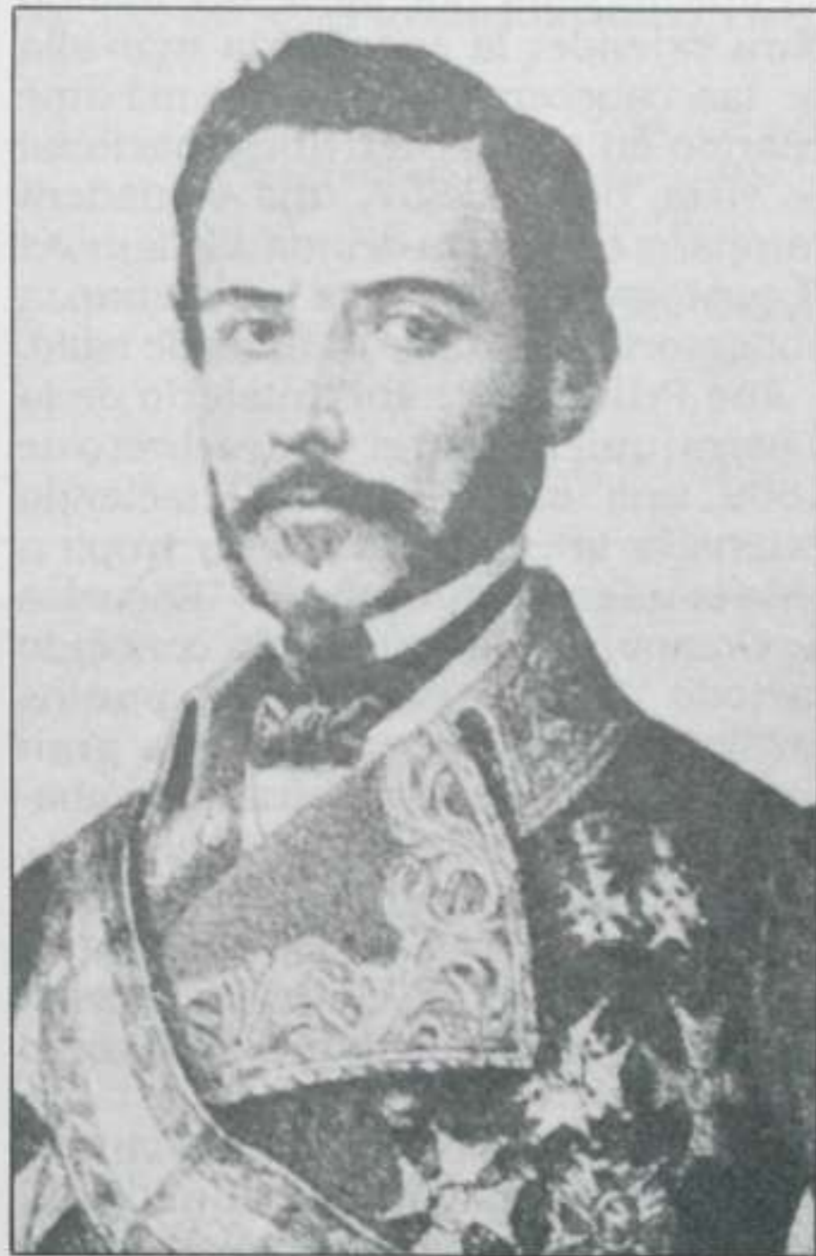
Los Generales Prim y Primo de Rivera fueron decisivos impulsores de la enseñanza primaria en los cuarteles.

El profesorado quedaba, como siempre, asignado a las clases de tropa, (cabos y sargentos) y la enseñanza en general sería supervisada en todos los detalles por un oficial nombrado por el Jefe Principal. Así el efecto limitativo