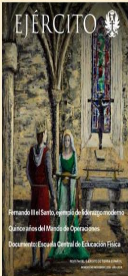
Portada del ejemplar del mes de noviembre

La revista Ejército nº 943 ya está disponible para su consulta o descarga