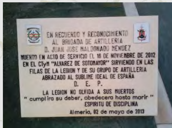
Monumento del GACA II y Placa homenaje al brigada Maldonado