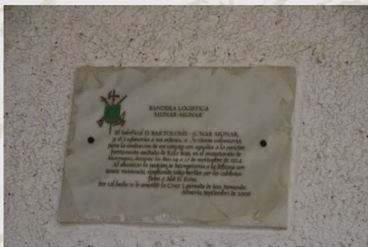
Placa de homenaje al suboficial Munar

En septiembre de 2006 se da nombre al edificio de la PLMM del GL II y se coloca una placa de homenaje al “Suboficial Munar Munar”