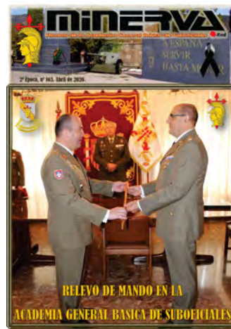
Minerva n° 163