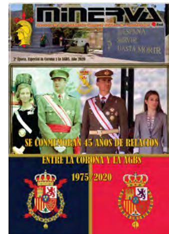
N° Especial a la Casa Real

“ puede ampliar todas estas noticias en nuestra web: https://www.amesete.es ”