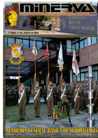
Minerva n° 162