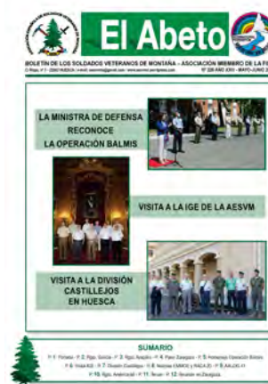
El Abeto n° 226

Consultar otras publicaciones de interés (click en los enlaces):