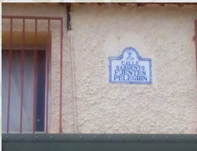
Monolito de homenaje a los caídos del GL II y placa de la calle del sargento Fuentes Pelegrín