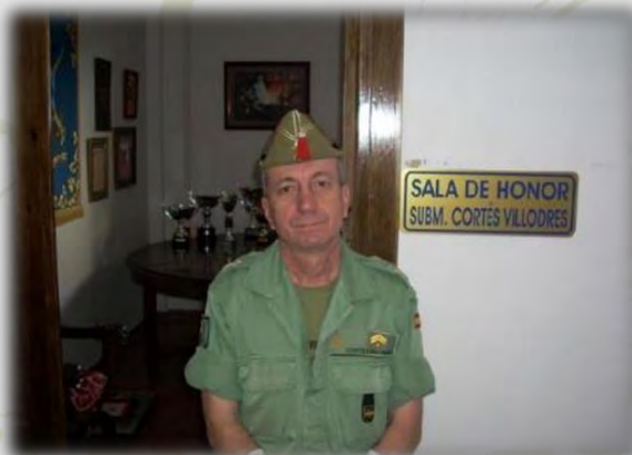
Interior de la Sala de Honor de la BCG y el SBMY Cortés en la entrada de la misma