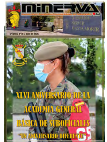
Minerva n° 164