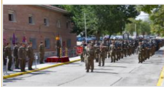
Desfile durante el acto