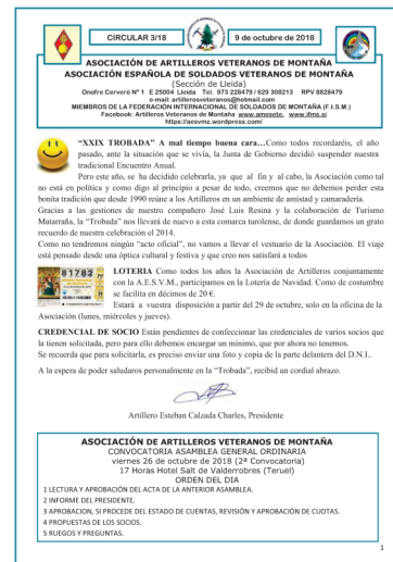
Circular 3-18 AAVM.

“ puede ampliar todas estas noticias en nuestra web: https://www.amesete.es ”