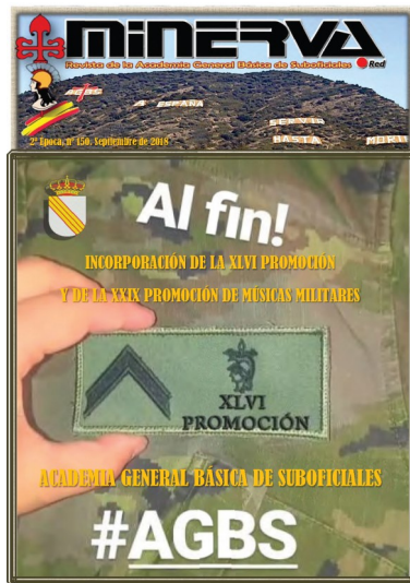
Revista Digital Minerva nº 150