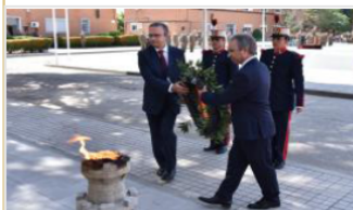
Un nieto del sargento y un veterano con la corona