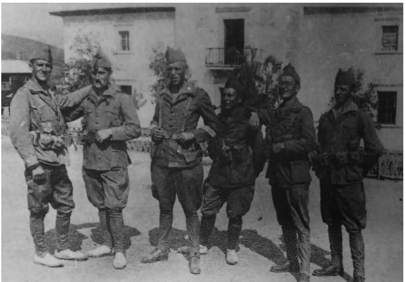
Entre los primeros extranjeros alistados en el Tercio destacaron los alemanes. En el centro de la imagen un rubio prusiano ya con los galones de sargento