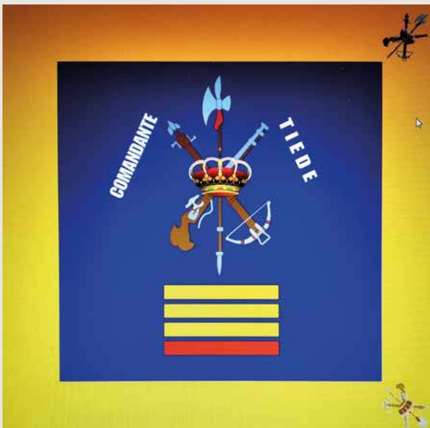
Cuando se creó la XI Bandera recibió el nombre de comandante Tiede

El coronel Millán Astray tomó el relevo en el mando del tercio, manteniendo a Tiede en su puesto. El 4 de marzo de 1926 era ayudante de la columna que mandaba Millán Astray en