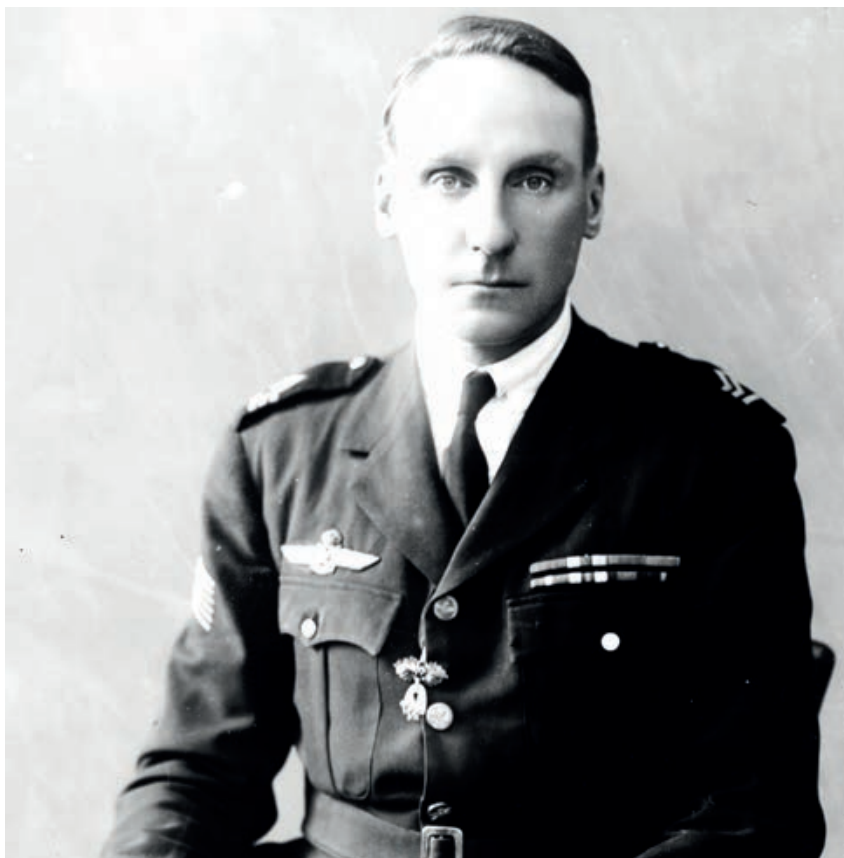
Comandante Alfonso de Orleans y Borbón

- Jefe de base. Tres galones bordados, de la forma que aparece en el dibujo, de cinco milímetros de ancho. Por debajo una barra de cinco milímetros de ancho.